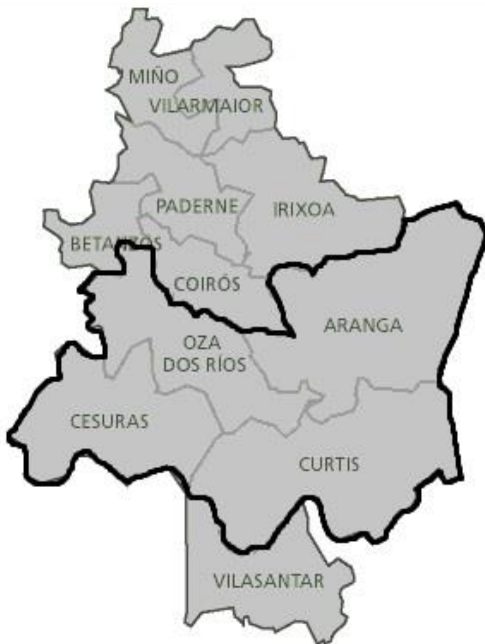
Localización de los tres municipios