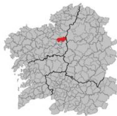
Localización de Curtis.

Curtis limita con Aranga y Oza-Cesuras al norte, al sur con Sobrado y Vilasantar, con Guitiriz al este, al oeste con Oza-Cesuras y con Mesía. Ocupa aproximadamente una superficie de 117km cuadrados, distribuidos en 4 parroquias: Fisteus, Santaia, Santa Eulalia de Curtis y Foxado, y dos núcleos urbanos: Curtis y Teixeira. 8