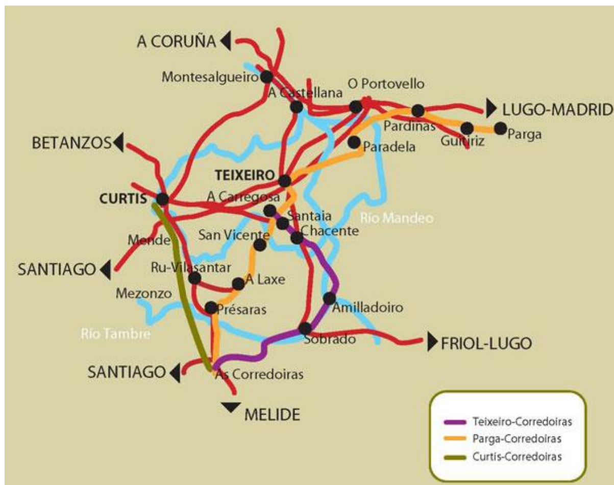
Tres posibles rutas