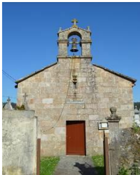
Fachada principal de San Esteban de Parada.

A poca distancia de estas capillas se encuentra la iglesia parroquial de San Esteban de Parada, un edificio de una única nave, con tejado a dos aguas y planta rectangular rematada en ábside. En el interior, encima de la puerta de entrada, hay un coro alto, y en el lado contrario, un retablo historicista de madera policromada, en el cual se encuentran tres imágenes separadas por cuatro columnas, un San Roque a la izquierda, un San Esteban en el centro, de mayor tamaño que las demás tallas, y a la derecha, una Asunción. En la parte superior del retablo hay otra pequeña imagen de un sacerdote, y coronando la estructura se puede ver una gran estrella dorada con una representación del Ojo de Dios en el centro.