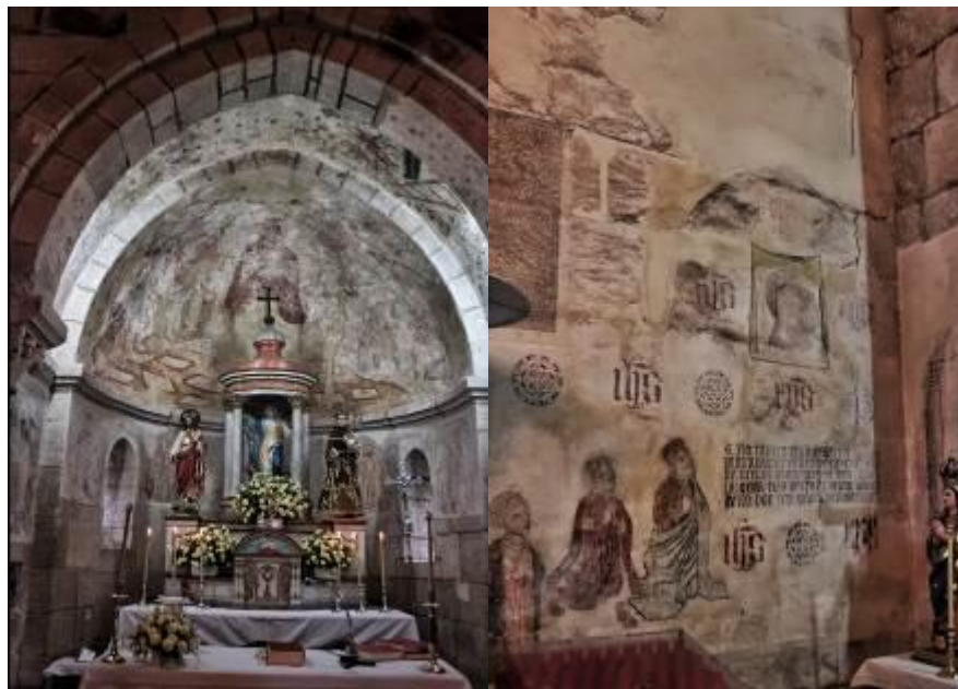
Interior de la Iglesia de Cuiña.

Dentro se puede ver, separando el presbiterio de la nave, un arco apuntado, apoyado sobre columnas adosadas al muro cuyos capiteles presentan ornamentos vegetales. Pero sin duda, lo que más llama la atención del interior, son las pinturas murales, datadas del s.XVI, fueron descubiertas al retirar un retablo durante unas obras llevadas a cabo en el año 1971, fueron restauradas por la Fundación Juan March. Las pinturas son de estilo gótico hispano-flamenco, todas presentan las mismas características, típicas de la pintura de la época: carencia de orden espacial, jerarquización o existencia de motivos ornamentales en los fondos . Se conoce al pintor que realizó estas obras, como el Primer Maestro de Santa María de Cuiña, quien es considerado como uno de los pintores gallegos más reconocidos de ese tiempo.