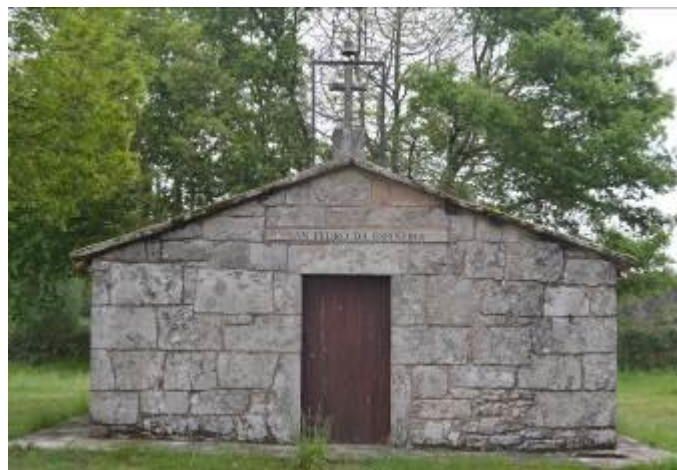
Ermita de la Espiñeira.