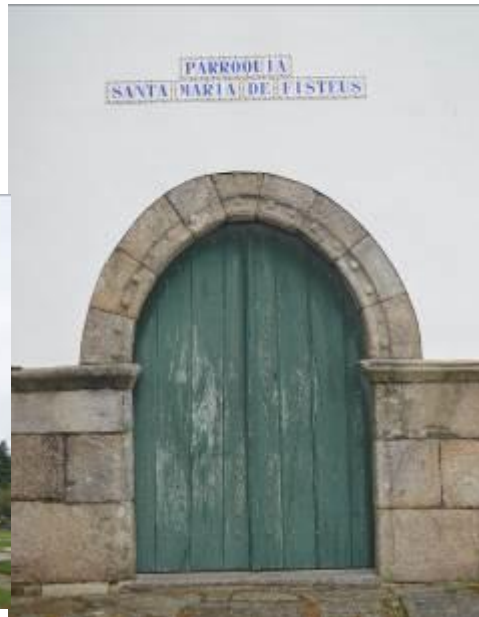
Lateral de la iglesia (izquierda) y puerta principal (derecha).