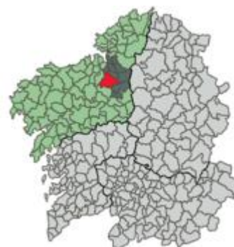
Localización de Oza-Cesuras.

Oza-Cesuras es un municipio que surge en 2013, fruto de la unión entre los ayuntamientos: Oza de los Ríos y Cesuras. Limita con Abegondo, Mesía y Curtis. Presenta una superficie de aproximadamente 152km cuadrados repartidos en 25 parroquias, 12 pertenecían a Oza y 13 a Cesuras, entre las más conocidas tenemos: Bandoxa, Trasanqueros, Figueredo, Cines, Regueira, etc. Pertenece a la comarca de Betanzos.