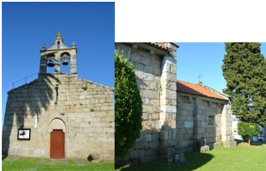
Fachada principal (izquierda) y ábside (derecha).