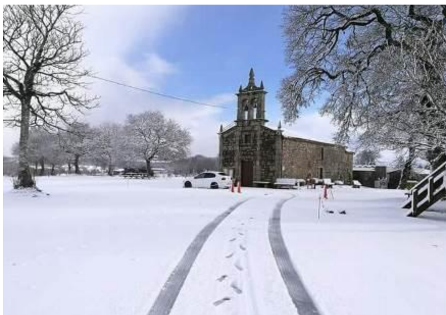
Exterior de la Iglesia de Nuestra Señora de Belén.

La iglesia parroquial es, de entre todas las estudiadas en este trabajo, la más sencilla, ya que además de presentar las mismas características arquitectónicas que las demás, tiene un tamaño bastante reducido y carece de ornamentos. A su entrada se encuentra un crucero, también muy sencillo y austero. Dentro de la iglesia se conserva una imagen tallada de San Cipriano 14 , santo venerado por sus milagros, ya que, según se dice, durante un incendio que asolaba la comarca, los vecinos en un último intento por frenar el avance de las llamas, colocaron al santo frente al fuego y este se apagó, parte de la talla se quemó, y como prueba de lo que había ocurrido, el párroco y los feligreses se negaron a restaurarla, hoy se mantiene expuesta en la iglesia, en la parte más alta del retablo, mientras que es una nueva imagen de San Cipriano la que se saca en procesión junto con la Virgen de Belén y San Andrés, durante la romería que tiene lugar a finales de verano.