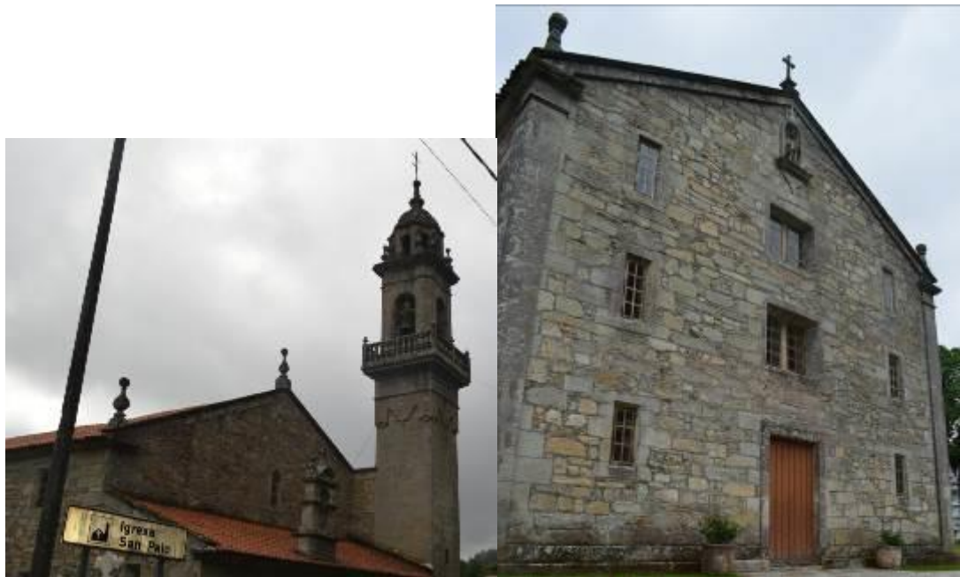
Torre-campanario (izquierda) y fachada principal (derecha).

La iglesia parroquial de San Paio de Aranga llama la atención principalmente por sus grandes dimensiones, es de estilo barroco y fue construida a lo largo del s.XVIII. No existe documentación al respecto, pero en base a su tamaño, a su organización interior y a que fue construida por los monjes de Sobrado, se piensa que se construyó con la intención de utilizarla como monasterio. Tiene planta de cruz latina dividida en tres naves, en la nave principal hay dos capillas comunicadas entre sí mediante una bóveda de cañón, en las naves laterales se encuentran el coro y el baptisterio. En la fachada principal hay una puerta adintelada con seis vanos y encima de ella, la imagen de un San Paio que todavía conserva restos de su policromía original, adosada a dicha fachada se encuentra una torre-campanario de tres cuerpos, el primero tiene la misma altura que la iglesia, el segundo finaliza con una balaustrada y el tercero remata en una pequeña cúpula. En su interior se guarda una reliquia muy importante para los devotos del lugar: unas cuantas astillas de la Santa Cruz.