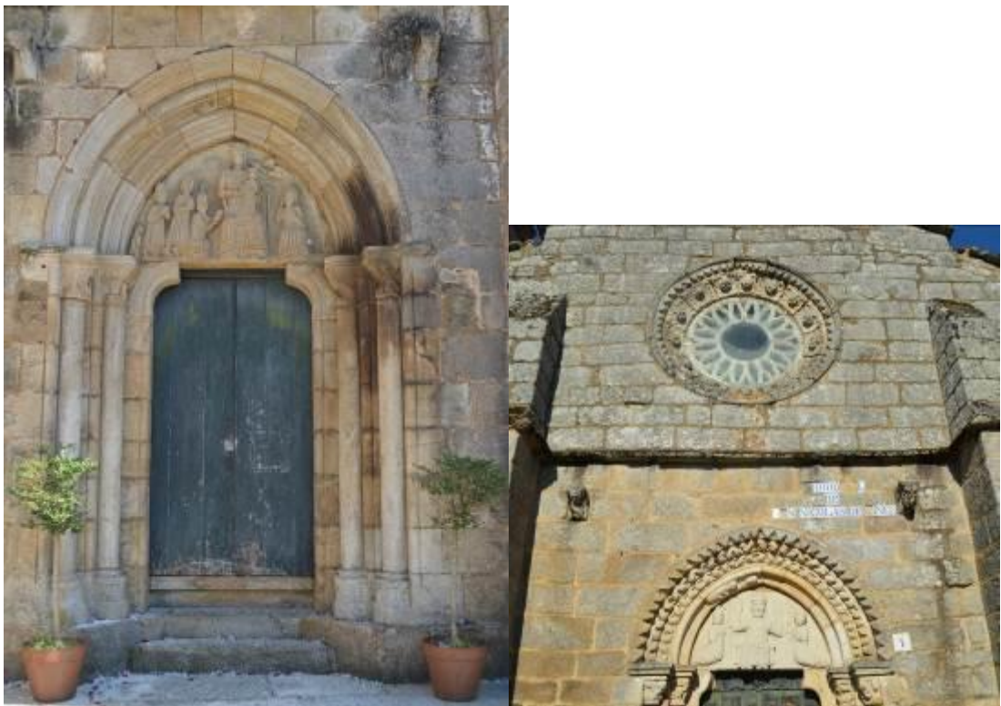
Puerta de la fachada norte (izquierda) y tímpano y rosetón de la fachada oeste (derecha).

Esta iglesia, antiguamente consagrada a San Nicolás, se construyó en el s.XIV, sobre los restos de la antigua capilla del monasterio, de estilo mozárabe. Es de planta basilical con tres naves rematadas en tres ábsides, de los cuales el central es heptagonal y los laterales son pentagonales. En la fachada occidental llama la atención un imponente rosetón, situado sobre la puerta principal, que a su vez está coronada por una serie de arcos apuntados y en su tímpano se puede ver una representación de San Salvador, acompañado de San Nicolás y San Benito. La otra puerta de entrada, situada en la fachada norte, tiene representada la escena de la Epifanía, en la cual se puede ver como los tres Reyes Magos adoran a Jesucristo.