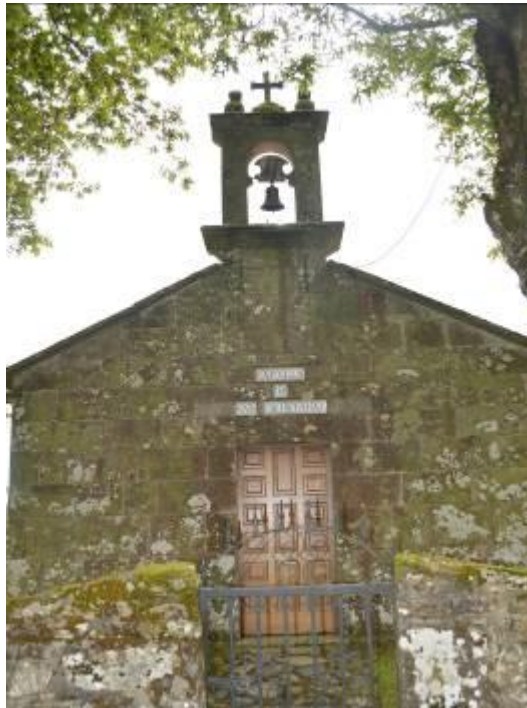
Ermita de San Cristóbal.

Ambas ermitas se encuentran en la parroquia de Foxado, datan de finales del s.XI y arquitectónicamente son iguales, son de planta rectangular, de una sola nave, su fachada principal es sencilla, en la de San Cristóbal remata en una espadaña simple y en la de Espiñeira en una cruz. Ambas tienen cubierta a dos aguas. En el interior de la ermita de San Cristóbal se puede ver un sarcófago antropomorfo y un retablo de pequeñas dimensiones, dedicado al santo que le da nombre a la capilla.