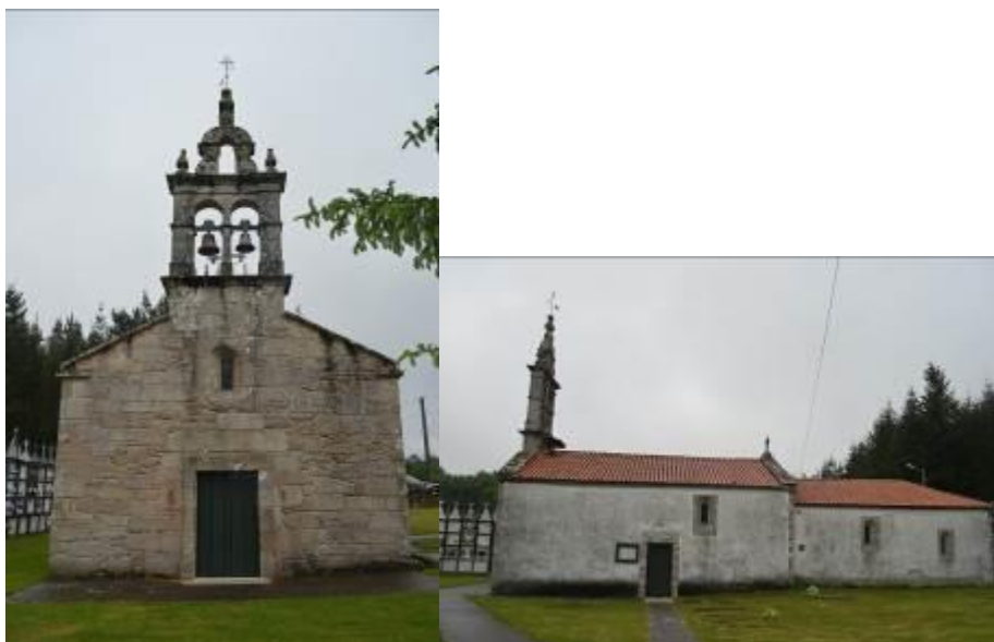
Fachada principal (izquierda) y fachada lateral (derecha).

La iglesia de San Pedro de Feás, situada en la parroquia de su mismo nombre, es una construcción de estilo barroco rural, de planta y ábside rectangulares, con una única nave y sacristía detrás del altar. Tiene dos puertas de entrada, una en un lateral y otra en la fachada principal, encima de ésta última se encuentra una pequeña ventana que es la encargada de aportar luz al interior del templo ya que no hay más aperturas en los otros lados, y, coronando dicha fachada, se puede ver una espadaña barroca con capacidad para dos campanas.