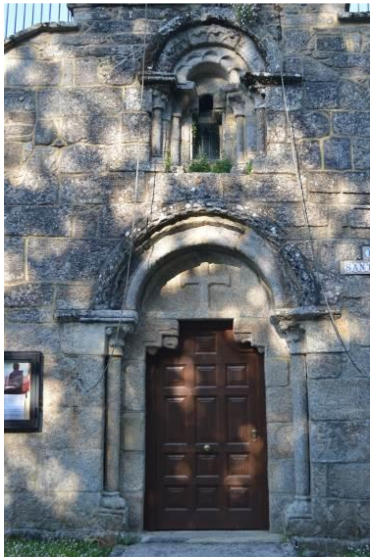
Puerta principal y ventana abocinada, ambas ornamentadas con arquivoltas y columnas.

En la actualidad no se conserva prácticamente ningún elemento propio del románico en este edificio ya que se reconstruyó casi en su totalidad durante el pasado siglo debido a su deterioro, lo único de la iglesia original que queda todavía en pie es una de las fachadas, concretamente la principal, en la que además se encuentra una pieza única y de gran valor artístico, una ventana románica cuyas características distan mucho de las presentes en otras de su mismo estilo, dicha ventana es abocinada y está rodeada por una serie de arquivoltas de medio punto que descansan sobre columnas cuyos capiteles tienen ornamentos vegetales. Este elemento resulta original en las iglesias románicas, ya que suelen tener un rosetón o ventanas más austeras.