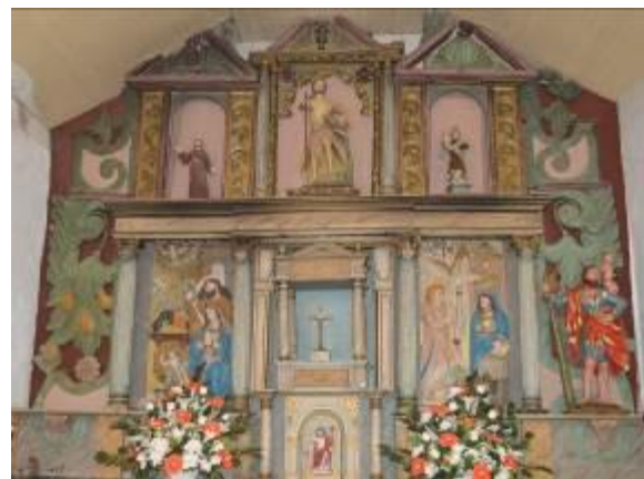
Retablo de San Cristóbal de Muniferral.

En el interior de la iglesia se puede ver un arco de medio punto separando la nave del ábside, un coro alto y un retablo policromado, en el cual se encuentran representaciones de la Sagrada Familia, la Anunciación, la Virgen del Carmen, San Cristóbal, San Juan Bautista y San Francisco, reconocible por los estigmas que presenta en manos y pies.