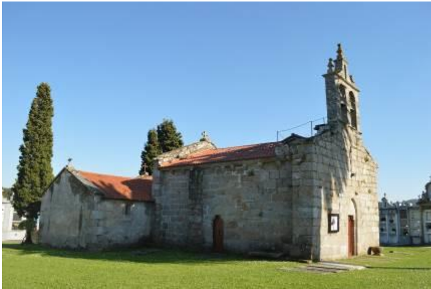
Exterior Iglesia de San Pedro de Oza.

En esta parroquia se encuentra la iglesia parroquial de San Pedro de Oza, un edificio de estilo románico del s.XII, aunque con decoraciones que ya avanzan un estilo gótico, se trata de una construcción con una única nave ábside rectangular cubierto por una bóveda de cañón, tejado con cubierta a dos aguas y canecillos con decoraciones geométricas. En la fachada principal se encuentra la espadaña, la cual es de estilo barroco, y adosada a la fachada norte se encuentra una sacristía.