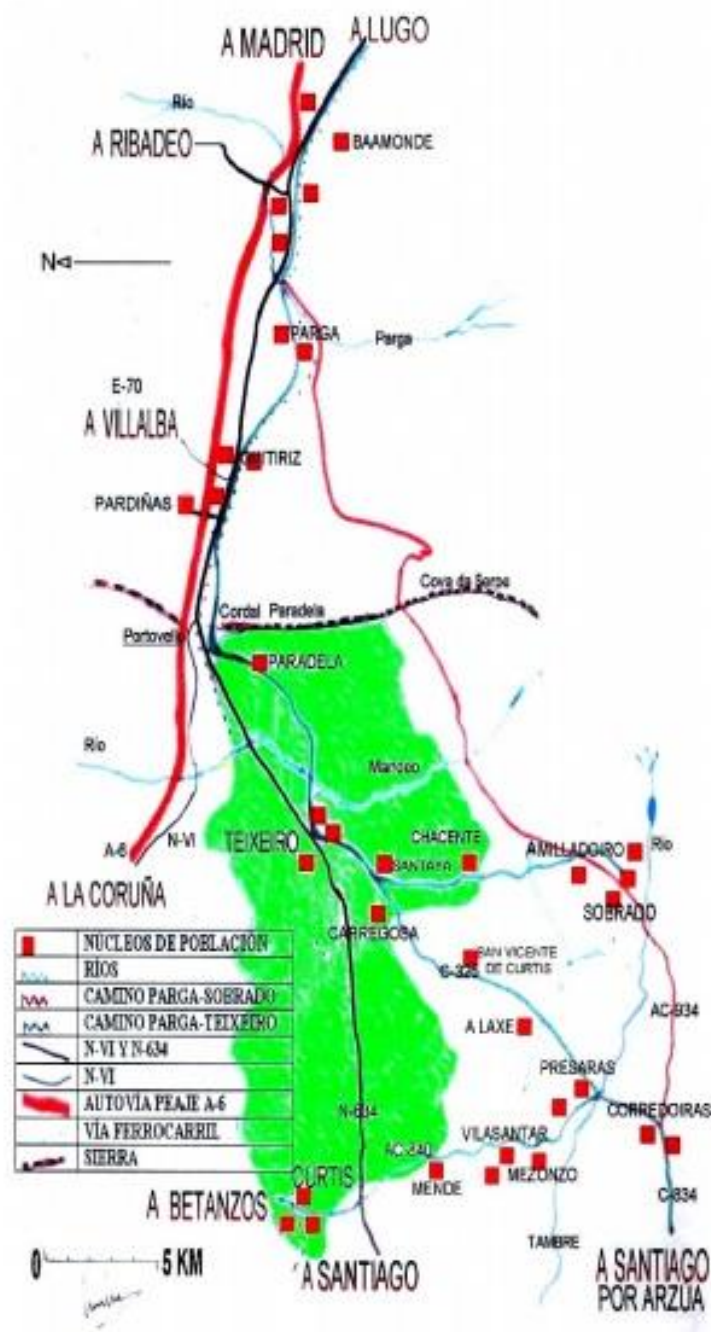
Mapa orientativo del Camino del Norte