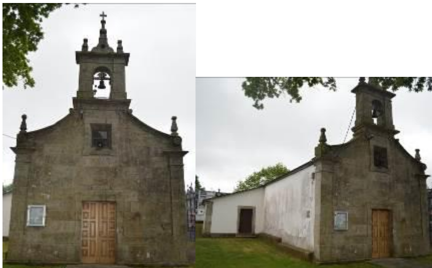
Fachada principal (izquierda) y fachada lateral (derecha).

La capilla de Santiago de Paradela, situada en la parroquia de Foxado, fue construída en el s.X y restaurada en su totalidad en el s.XIII, por lo que es de estilo barroco. Al igual que todas las iglesias de la zona, es bastante austera, no cuenta con grandes ornamentos en el exterior, sino que reserva las decoraciones para los retablos del altar. El edificio actual es de planta y ábside rectangulares, consta de una única nave, cubierta a dos aguas y espadaña en la fachada principal.