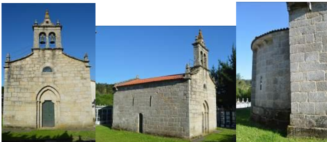
Fachada principal (izquierda), fachada occidental (centro) y ábside (derecha).

El exterior es austero, presenta muros lisos, sin contrafuertes, y una fachada con arquivoltas. Se puede acceder a la nave mediante dos puertas, una en la fachada oeste, adintelada en el interior, y otra en la norte, que remata en un arco apuntado con tímpano liso, existen indicios de la existencia de una tercera puerta, probablemente de época medieval, actualmente tapiada.