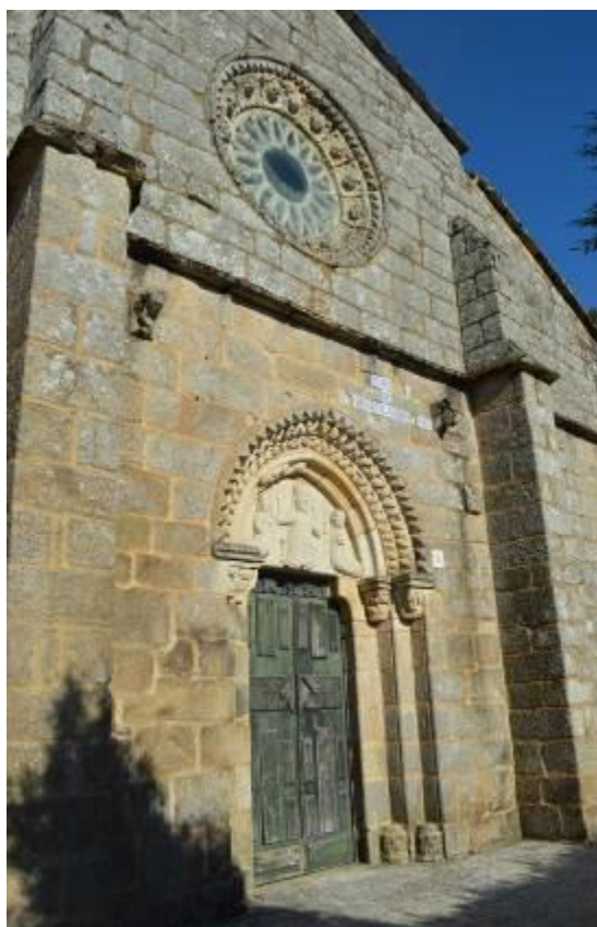
Fachada principal de San Nicolás de Cines.

Para finalizar con las iglesias del municipio de Oza-Cesuras, se hablará de la que es, quizás la más conocida y llamativa de la zona, la Iglesia de San Nicolás de Cines. Para hablar de sus orígenes es necesario remontarse a principios del siglo X, pues fue en esa época cuando los condes Don Alvito y Doña Paterna, fundaron el Monasterio de San Salvador de Cines, fue propiedad de las monjas que vivían allí y de sus fundadores hasta que tuvo lugar, en el año 1836 la Desamortización de Mendizábal, y las propiedades del monasterio pasaron a pertenecer al Estado. 16 El paso de los años, unido a la falta de interés del Estado por preservar el patrimonio eclesiástico, dejaron al monasterio totalmente en ruinas, lo único que se conserva es la Iglesia, de estilo gótico, que es además una de las pocas edificaciones de ese estilo que hay en Galicia.