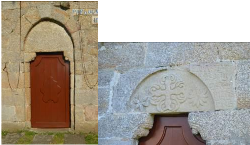
Puerta principal (izquierda) y tímpano de la puerta norte (derecha).

La puerta principal es sencilla, está situada bajo un arco apuntado y tímpano liso, sobre otra de las puertas, la de la fachada norte, se encuentra un tímpano ornamentado con una cruz de consagración, algo insólito ya que ese tipo de decoraciones suelen encontrarse en el interior de los edificios, acompañando a la cruz hay dos estrellas, de seis y de doce puntas, las cuales son una representación del sol y la luna, y al mismo tiempo como una variante de los caracteres griegos alpha y omega , que simbolizan que Jesucristo es el principio y el final de todas las cosas.