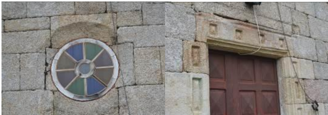
Rosetón (izquierda) y friso de la puerta principal (derecha).

Es sobria y sencilla, la mayoría de ornamentos se encuentran en la fachada principal, en ella se puede ver la puerta de entrada, decorada con un friso, un rosetón con vidrieras y una espadaña sencilla coronada por dos pináculos y, entre ellos, una cruz de hierro.