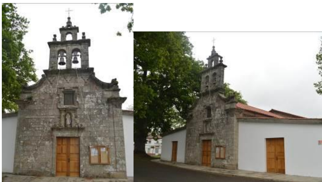
Fachada primitiva (izquierda) y fachada actual (derecha).

También en la parroquia de Santa Eulalia se puede encontrar la iglesia de Nuestra Señora de los Remedios, de estilo barroco, construida entre los s.XVII y XVIII con la intención de cristianizar un lugar que se usaba para realizar rituales celtas. Se reconstruyó a mediados del s.XIX, modificando la estructura original al añadir una planta basilical de tres naves y dejando como únicos vestigios de la construcción primitiva, el arco de entrada y la espadaña doble.