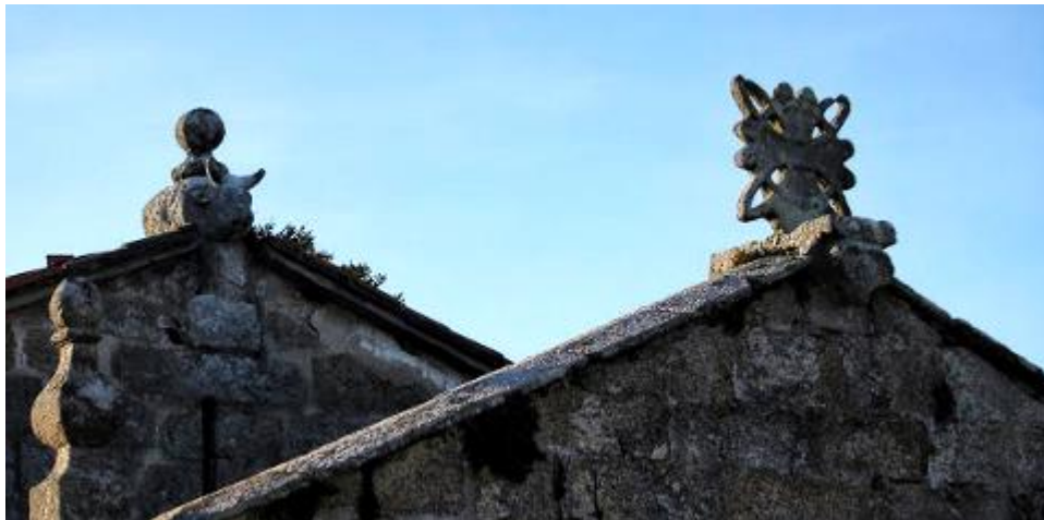
Toro y cruz en el tejado de la nave y del ábside, respectivamente.

En el piñón de la nave se puede ver una escultura de un toro sosteniendo un pequeño pináculo de estilo barroco, era común situar este tipo de figuras en las iglesias, ya que se tenía la creencia de que mantenían alejadas a las meigas durante la celebración de las romerías. Por otro lado, en el piñón del ábside, se encuentra una cruz antefija sostenida por un sillar, el cual tiene forma de cabeza de carnero.