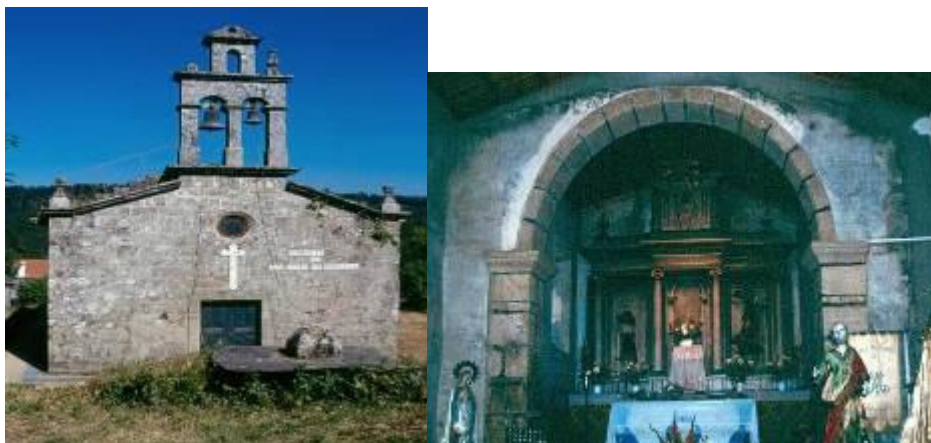
Fachada principal (izquierda) y retablo (derecha).

Por último, se encuentra la iglesia de San Pedro de Borrifáns, una capilla sencilla, de planta y ábside rectangulares, en su interior se encuentra un arco de medio punto, separando la nave del altar, donde destaca especialmente su retablo historicista. La fachada exterior presenta cubierta a dos aguas, y un campanario doble de estilo barroco. En la fachada principal, encima de la puerta se puede encontrar una cruz blanca, y encima de ésta, una pequeña vidriera redonda.