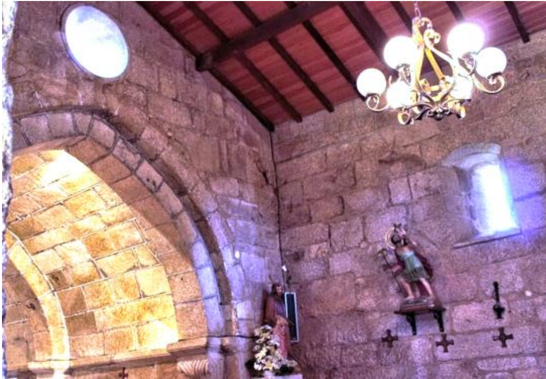
Interior de San Pedro de Oza.

En el interior, la única nave está cubierta por una bóveda de cañón, el ábside cuenta con dos arcos apuntados, sostenidos por cuatro columnas, cuyos capiteles están decorados con motivos vegetales. Cabe destacar que se conserva el pavimento del edificio original.