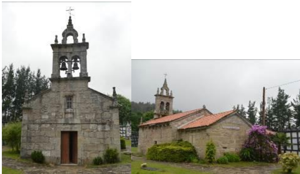
Fachada principal (izquierda) y parte trasera (derecha).

La iglesia de San Cristóbal de Muniferral es la única de estilo románico que se encuentra en Aranga, fue construida en el s.XII aunque fue reconstruida siglos después y la fachada, la espadaña y la sacristía son barrocas. Tiene una sola nave rematada en ábside rectangular y cubierta a dos aguas. Conserva elementos arquitectónicos que pertenecían a la capilla original, como es el caso de los canecillos antropomorfos y zoomorfos. En el testero del ábside se pueden observar los daños causados por una mala restauración, en la cual se utilizó cemento para unir las piedras entre sí, y se dejaron los restos sin pulir, rompiendo la armonía del resto del edificio.