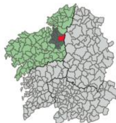
Localización de Aranga.

El ayuntamiento de Aranga se sitúa en la parte centro-septentrional de Galicia, limita al norte con los ayuntamientos de Monfero e Irixoa, al oeste con Oza de los Ríos y Coirós, al sur con Curtis y al este con Guitiriz (perteneciente a la provincia de Lugo). Tiene una superficie de aproximadamente 120km, divididos en seis parroquias: San Pedro de Cambás, San Lorenzo de Vilarraso, San Pedro de Feás, San Paio de Aranga, San Cristóbal de Muniferral y San Vicente de Fervenzas. Todas ellas pertenecen a la diócesis de Santiago.