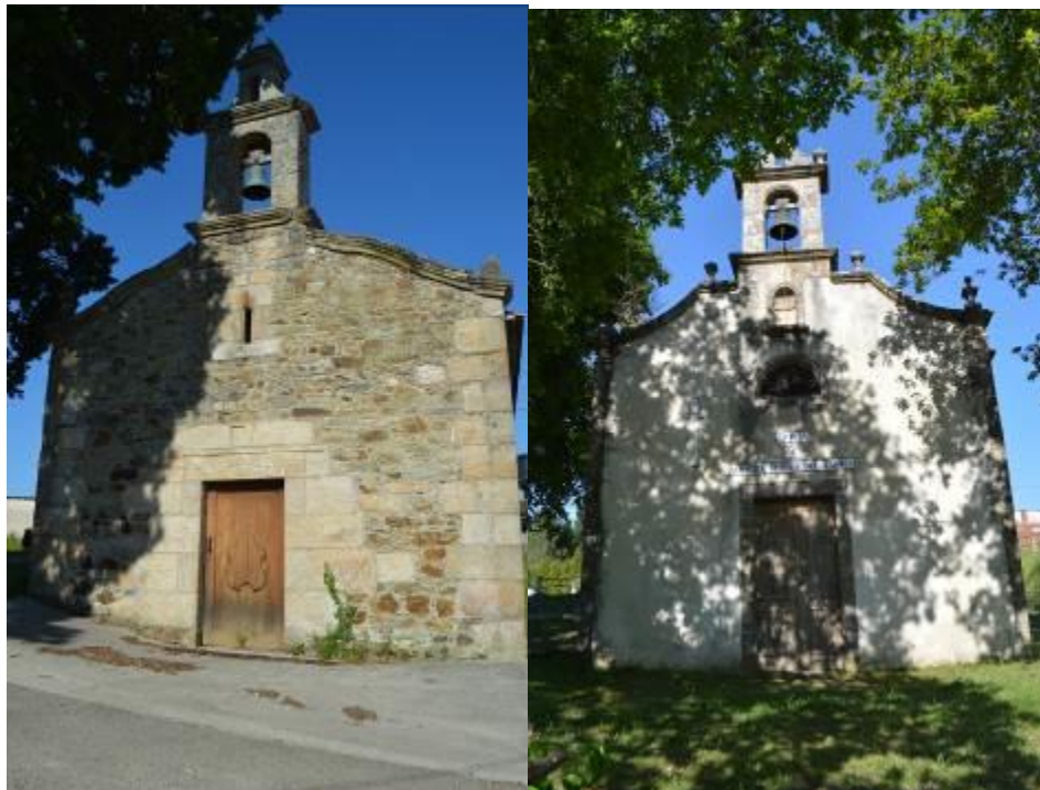
Capilla de la Natividad (derecha) y Capilla del Carmen (izquierda).

En la fachada principal de la capilla de la Natividad se puede encontrar una cruz de consagración y una piedra con una inscripción, ahora ilegible.