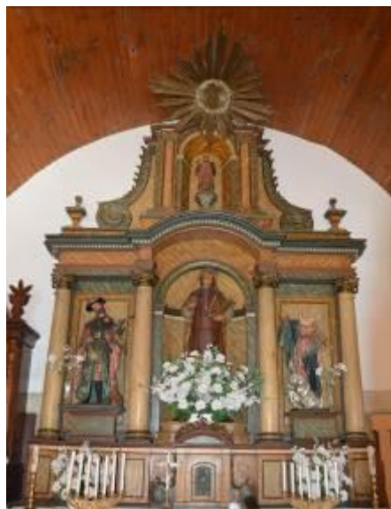
Retablo de San Esteban de Parada.