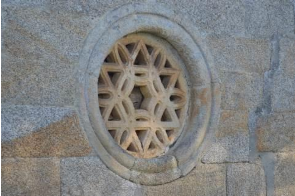
Rosetón de San Pedro de Porzomillos.

El edificio es de planta rectangular, con una única nave, la cual finaliza en un ábside, cuya forma y ornamentos distan mucho de las construcciones típicas de esa zona, ya que, en lugar de la habitual ventana, en el testero del ábside, se puede encontrar un rosetón, de clara influencia árabe y de aproximadamente 1m de diámetro.