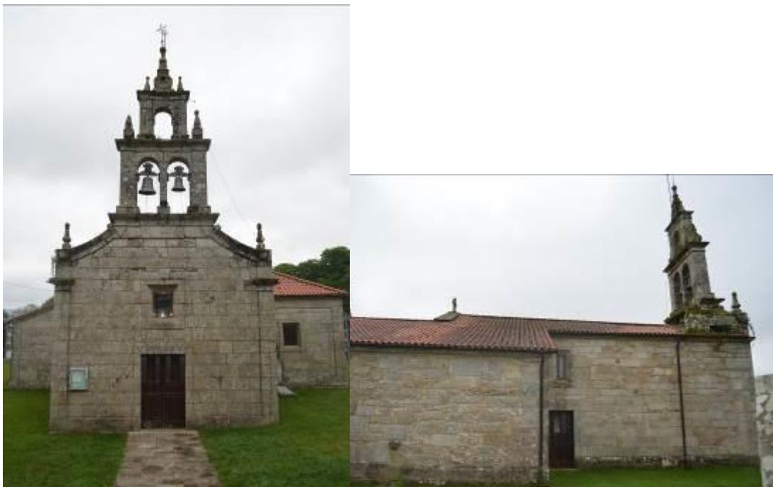
Fachada principal (izquierda) y fachada lateral (derecha).

La iglesia actual es un edificio sencillo, tiene una única nave, la cual está cubierta con una bóveda de madera, en uno de sus extremos hay una sacristía y en el otro una capilla cubierta con una bóveda nervada. La fachada principal remata en una espadaña sencilla y exteriormente la iglesia está poco ornamentada. Destacan también los retablos de estilo barroco que se pueden encontrar en el interior, el del altar principal sigue la línea del estilo barroco, es recargado, policromado en tonos que van desde el dorado hasta el rojo, pasando por el azul, y tiene cinco imágenes de santos y de la Virgen María.