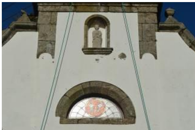
Vidriera y escultura de San Pedro encima de la puerta principal.