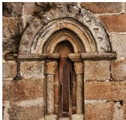
Ventana del ábside.

En el testero del ábside se encuentra una curiosa ventana datada del s.XIII, que es el perfecto ejemplo de la mezcla de estilos que se encuentran en la iglesia, puesto que la apertura en sí, es románica, pero se encuentra situada bajo dos arcos ligeramente apuntados, lo que evidencia que el estilo gótico empezaba a estar presente en la arquitectura gallega.