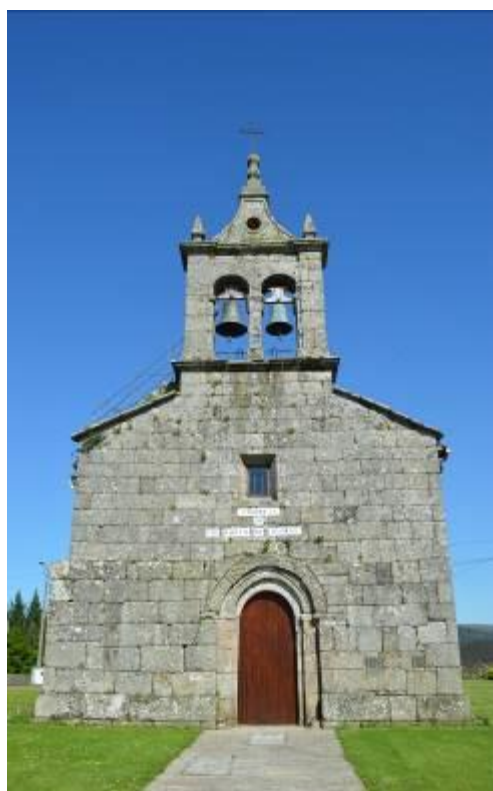
Fachada principal de S. Martín de Bandoxa.