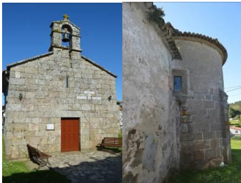
Fachada principal (izquierda) y ábside (derecha).

En esta parroquia se encuentra la Iglesia de Santiago, consagrada a dicho apóstol, se trata de un edificio de estilo románico, construido en el s.XII, de planta rectangular, con una única nave, terminada en un ábside semicircular, elevado sobre un pequeño basamento. La iglesia actual es una modificación de la primitiva ya que se prolongó el ábside y se variaron las dimensiones de la nave. En el interior, un arco de medio punto separa el ábside de la nave, elevado sobre ésta, en la entrada principal, hay un coro alto. La decoración es austera, en las puertas se pueden ver tímpanos sencillos bajo arcos apuntados.