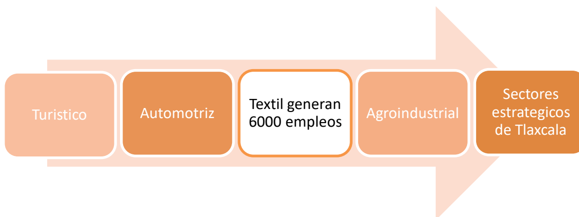
Figura 2: sectores estratégicos de Tlaxcala

gobierno del Lic. Luis Echeverría Álvarez (1970 – 1976), para comprar productos de la canasta básica (El salario busca valorar monetariamente el desempeño del trabajo por parte del empleado y es un método utilizado para motivar a los trabajadores ya que es una parte esencial para el desarrollo de sus vidas, cuando las personas se sienten a gusto y satisfechos con su trabajo, la productividad suele mejorar con beneficios económicos). La industria textil de Tlaxcala ocupa el segundo lugar en calidad de empleos en Tlaxcala: