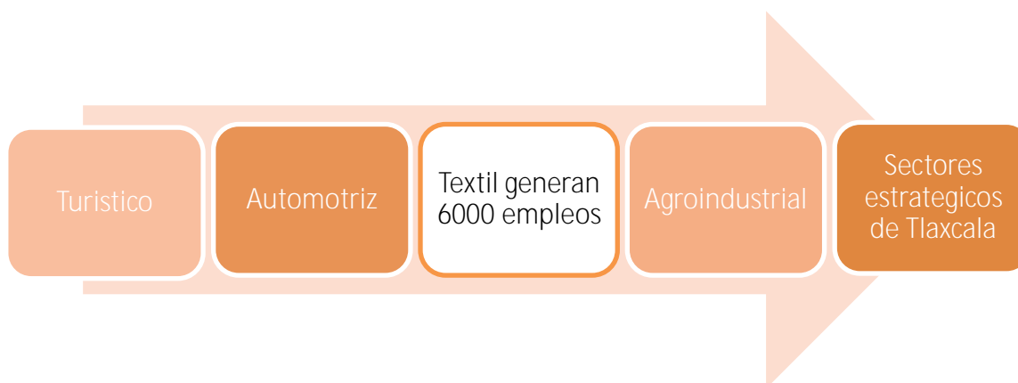
Figura 2: sectores estratégicos de Tlaxcala

gobierno del Lic. Luis Echeverría Álvarez (1970 – 1976), para comprar productos de la canasta básica (El salario busca valorar monetariamente el desempeño del trabajo por parte del empleado y es un método utilizado para motivar a los trabajadores ya que es una parte esencial para el desarrollo de sus vidas, cuando las personas se sienten a gusto y satisfechos con su trabajo, la productividad suele mejorar con beneficios económicos). La industria textil de Tlaxcala ocupa el segundo lugar en calidad de empleos en Tlaxcala: