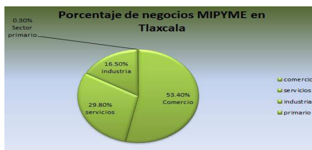
Figura 1: Porcentaje de negocios MIPYME en Tlaxcala

El Estado de Tlaxcala tiene una extensión territorial de 3,914 Km 2 , lo que facilita el recorrido a través de sus 60 Municipios, tiene una ubicación privilegiada en el centro de la República Mexicana, es la cuarta zona metropolitana del país con fuertes vínculos comerciales con el Distrito Federal, Puebla y Veracruz (Tlaxcala, 2012). Su población es de 1.2 millones de habitantes, en su mayoría jóvenes y la tasa de crecimiento poblacional es de 1.9%. El 94.8% de la población se considera alfabeta y la escolaridad promedio es de 8.8 años, 548,899 personas componen la Población Económicamente Activa, su Producto Interno Bruto (PIB) en 2012 fue de 71,327 millones de pesos, con un número de unidades económicas de 66 309, (Censos Económicos, 2009):