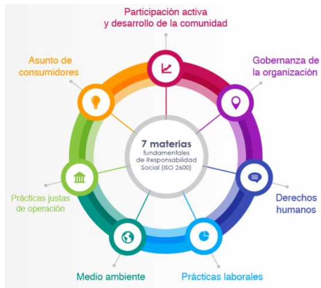
Figura 2 Materias fundamentales en la Responsabilidad Social (Secretaría Central de ISO, 2010)

1.-Derechos humanos: Son todos aquellos derechos que traen consigo los seres humanos desde que nacen, ejemplo de estos son: derecho a la vida y a la libertad, la libertad de expresión, derecho a la igualdad, existen otros que son derechos económicos, sociales, culturales, derecho al trabajo, a la alimentación a la salud, a la seguridad social.