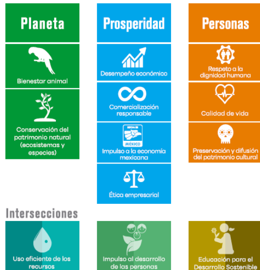
Figura 4. Modelo de sostenibilidad 2016 Grupo Experiencias Xcaret (Sitio Corporativo Experiencia Xcaret, 2016)