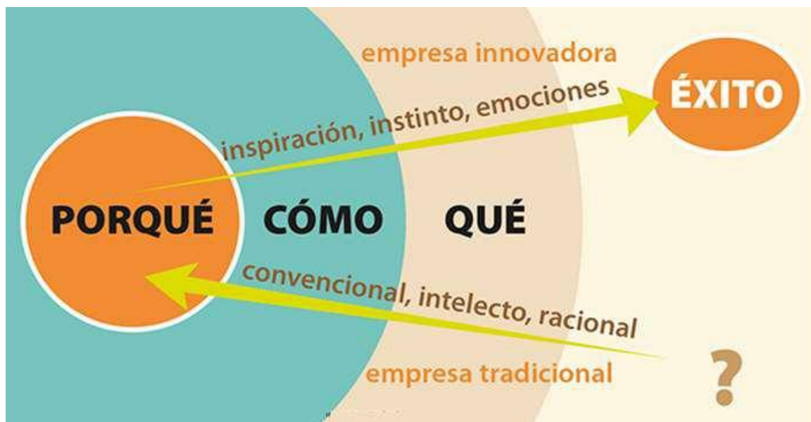
Modelo del Golden Circle

Su creador Simon Sinek lo describe como el patrón que siguen todas las empresas con alta relevancia. En la gran mayoría de empresas existentes, todos los colaboradores conocen lo que la organización realiza, desde el colaborador más humilde hasta la alta gerencia, pero pocos conocen “como” es que se hace, y en definitiva muy pocos pueden definir “por qué” lo hacen y paradójicamente este es el punto más importante, lo que todos los integrantes de la organización deberían comprender.