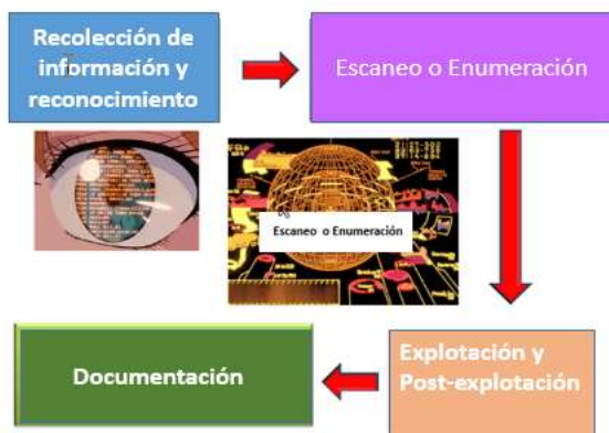
Figura 2. – Fases para la elaboración del Pentesting

Finalmente y basado en lo encontrado se elaboran dos reportes finales en la fase de documentación del Pentest, Informe Ejecutivo e Informe Técnico los cuales serán entregados a los directivos de la Grupo de Apoyo Nueva Era.