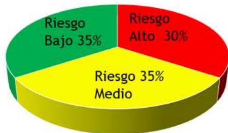
Vulnerabilidades Detectadas - ORFEO