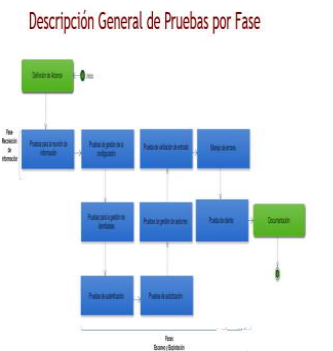
Figura 5. Descripción General de Pruebas por Fase de Pentesting

Para la evaluación de la seguridad de la Aplicación Web Orfeo (Sistema de Gestión Documental) Grupo de Apoyo Nueva Era se diseñó un Pentesting basado en la Metodología OWASP V.4. Descrito en la siguiente figura 5.