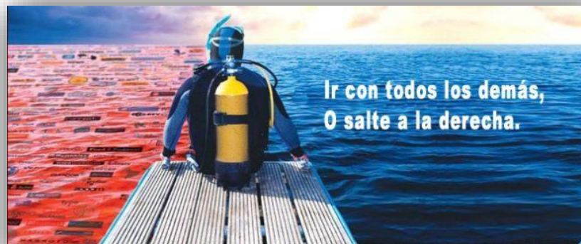
Figura 2. Océano rojo vs. océano azul (López, 2013)

En tanto, como estipula (Rezk, 2016), las empresas que se crean y marchan con destino a los océanos rojos, siempre se encaminan a extraer la mayor rentabilidad posible desde una posición de poder, ante proveedores, competidores y clientes cada vez más dependientes de los bienes que se producen. Negocian ferozmente y someten al oponente con el único objetivo de generar resultados financieros positivos para la organización.