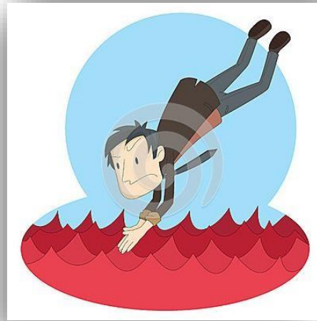
Figura 1. Hombre de negocios que aplica la estrategia de océano rojo

En definitiva, en los océanos rojos la competencia es voraz y su incursión se encuentra limitada por la entrega de precios bajos y valor añadido, así como por el ciclo de vida del producto o servicio ofertado. (Castellanos, 2015) Ya que, mientras aparecen un mayor número de ofertantes para dicha demanda, se reducen las perspectivas de ganancia y crecimiento para la organización, la competencia se vuelve muy complicada y la organización por tanto, tiende a actuar reactivamente en consecuencia. De este modo, las oportunidades de lograr una estrategia ganadora disminuyen según aumenta el número de competidores y los esfuerzos comerciales se encaminan a subrayar las diferencias respecto al resto de alternativas. (Urdiz, 2013)