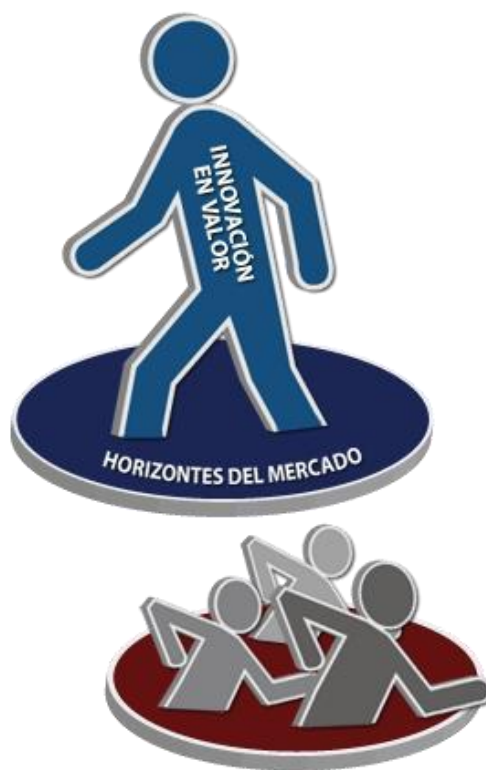
Figura 3. Estrategia océano azul (Artibus Consulting, s.f.)

Ante tales evidencias, las organizaciones que deciden incursionar en nuevos mercados llevando a cabo la estrategia de océano azul, deben considerar y aplicar los siguientes cuatro principios (Advanced Network Consulting, s.f.):