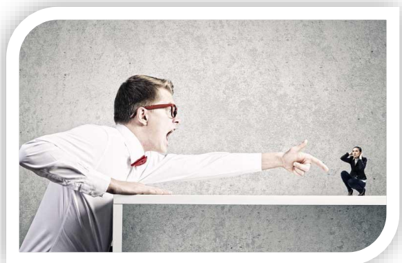
Figura 2. Mobbing

Ataques a la víctima a través de medidas organizacionales: Rechazo a reconocer su valía, trato inferior a los demás colaboradores, sobrecarga de trabajo o, por el contrario, asignación de tareas de poca valía, dejarle sin trabajo o robar documentos importantes, negarle la formación necesaria para realizar sus funciones, ser objeto de medidas disciplinarias por causas insignificantes o inventadas, etc.