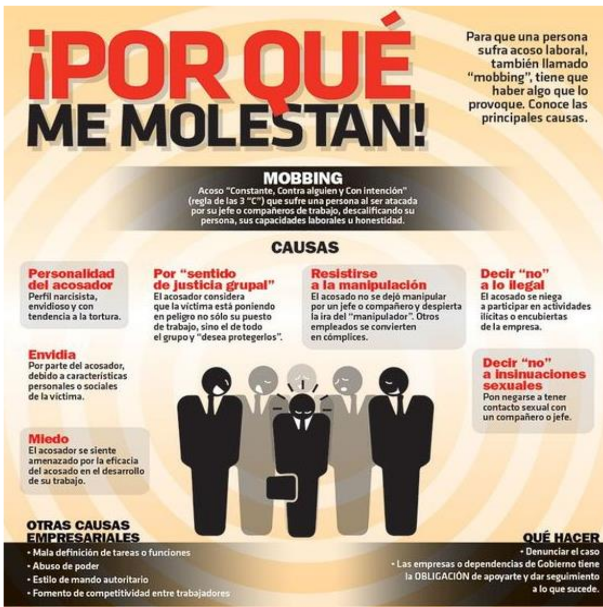
Figura 3. Causas del mobbing (Vela, 2015)