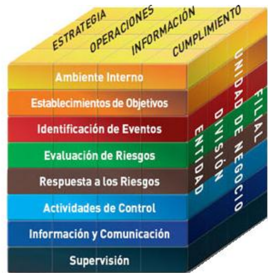
Figura 4. Control de riesgos (Vásquez, 2016)

Atendiendo estas consideraciones, los requisitos de calidad, fiabilidad, seguridad, mantenimiento y disponibilidad de sistemas y productos, se traducen en productividad. Y para optimizarla, desde la planificación estratégica de la organización, deben ser considerados los riesgos inherentes a su actividad empresarial y las maneras de administrarlos científicamente. (Cicco, s.f.)