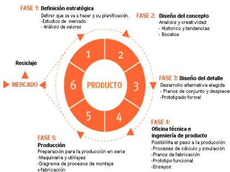
Figura 2. Fases del proceso de diseño industrial (Ros, 2015)

Entonces, si es preciso que los sistemas diseñados sean fiables, pero somos conscientes de que en algún momento se sufrirá un deterioro y posterior fallo, el nivel de fiabilidad o seguridad de operación satisfactoria dependerá de la naturaleza del objetivo del sistema, anticipándose a que el usuario pueda operarlo sin que exista un elevado riesgo.