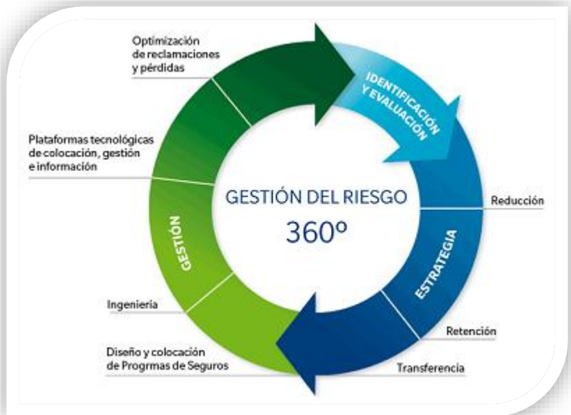
Figura 3. Gestión del riesgo (Asegurándome, 2014)

Análisis de Modos de Fallo y Efectos : Es una técnica concebida para la detección y control de riesgos originados en los equipos, pues identifica componentes críticos y genera una relación de contramedidas. Propicia un aumento de fiabilidad del sistema a través del tratamiento de componentes causantes de fallos de efecto crítico, ya que una vez efectuado el diseño del producto, y antes de proceder a su fabricación, se revisan sus diferentes componentes, comprobando si reúnen las características necesarias para su correcto funcionamiento. De este modo, para facilitar esta revisión, se muestran los posibles errores que pueden producirse en la operación del producto y se generan soluciones por orden de importancia, antes de que el producto se ingrese al mercado y entre en funcionamiento.