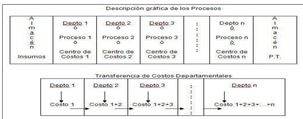
Gráfico No. 2