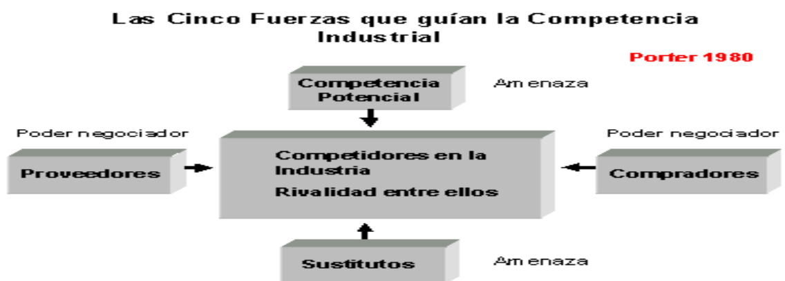
Figura 2.3. Modelo de las 5 Fuerzas de la Competencia de Porter 1980

Desde el punto de vista de (Porter, 1980) existen cinco fuerzas que determinan las consecuencias de rentabilidad a largo plazo de un mercado o de algún segmento de éste. La idea es que la corporación debe evaluar sus objetivos y recursos frente a éstas cinco fuerzas que rigen la competencia industrial: