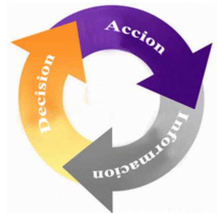
Figura 1: ciclo de inteligencia en los negocios