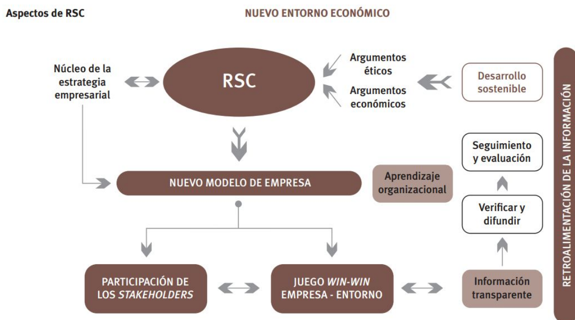
Ilustración 2 Nuevo entorno económico (Mirones, 2011)

La RSC consiste en asumir de manera consciente compromisos que van más allá de obligaciones convencionales y reglamentarias, que deberían de cumplirse bajo cualquier circunstancia.