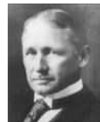
Frederick W. Taylor

Los incentivos económicos son el único elemento motivador del individuo Las organizaciones controlan las recompensas económicas y por tanto el comportamiento del individuo.