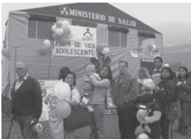
Segmentación del sistema de salud. Genera ineficiencias.