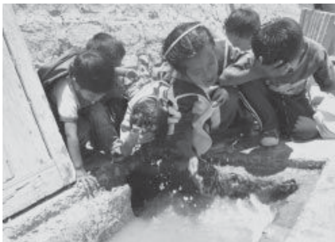
Agua potable. Solo 64% de los hogares accede a la red pública.