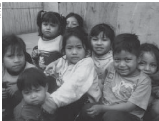
Demanda educativa en salud. Es superior a la oferta de las universidades e institutos.

«Nos encontramos frente a un campo desestructurado de recursos humanos, donde la precarización salarial/laboral y el desempeño han sido puestos en conflicto...»