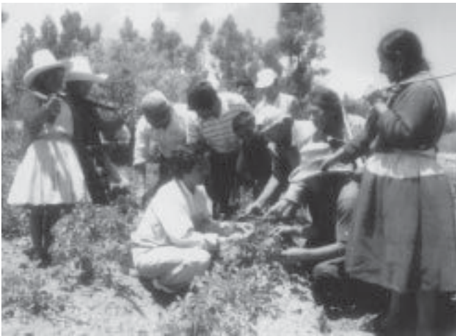
Ceplan. Se guía según una visión de futuro compartida por todos los actores.