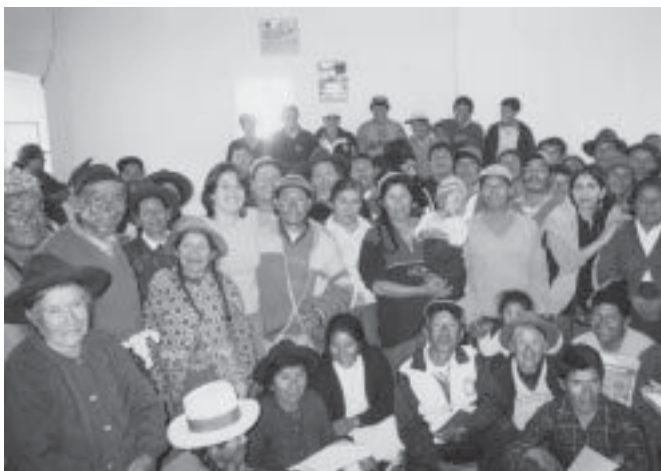
Descentralización. Es el proceso de reforma que ha generado mayor participación ciudadana.

recursos públicos; la población, con sus organizaciones sociales y legítimas aspiraciones; y la clase política, compuesta por los partidos 2 y sus dirigentes.