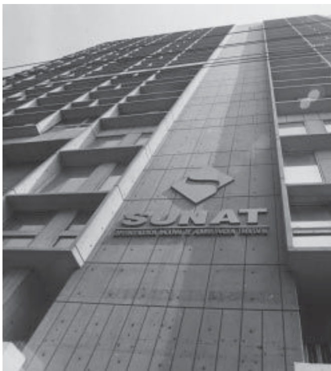
Relación Estado – mercado. El Estado debe regularlo y facilitar la creación de riqueza.

necesaria una intervención inteligente del Estado, mediante la promoción de los sectores excluidos —como la agricultura serrana y las microempresas— y la regulación de los mercados.