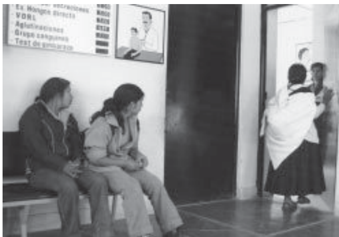
Programa de Educación Sexual. Culminó sus actividades en el año 2001.