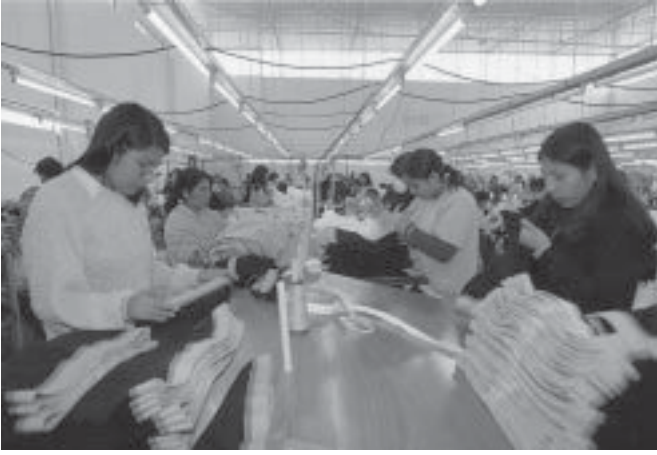
Calidad del empleo. Las trabajadoras de las MYPE son algunas de las que más trabajan.

también todas las formas de violencia sexual identificadas por la CVR. 2) El mejoramiento de la respuesta médico legal ante la violencia de género requiere la elaboración, aprobación, implementación y difusión de protocolos de atención que sean capaces de identificar y traducir la violencia familiar y sexual, tanto física como psicológica. En el caso de la violencia psicológica, el protocolo debería contemplar la posibilidad de su aplicación por profesionales de la salud no especializados, con el fin de no limitar el derecho a la salud y acceso a la tutela jurisdiccional efectiva a las personas que sufren violencia familiar.