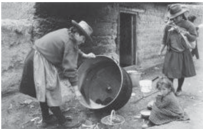
Condición de indocumentado. Es un impedimento para acceder a la ciudadanía formal.

de interacción entre los propios actores regionales y locales, públicos y privados.