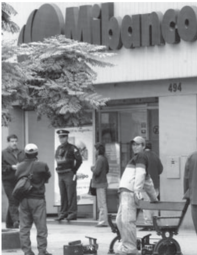
Discriminación laboral. Se debe evaluar el cumplimiento de la ley para prevenir la discriminación.

Promoción del Empleo (MTPE), en coordinación con el Congreso de la República, debe evaluar el cumplimiento de la ley que busca prevenir la discriminación en el acceso a las ofertas de empleo y a los medios de formación educativa. En segundo lugar, es necesario desvincular la cobertura de riesgos (salud y pensiones) de la modalidad de contratación laboral, sobre todo para las trabajadoras de las microempresas, garantizando así el derecho de atender su salud sexual y reproductiva.