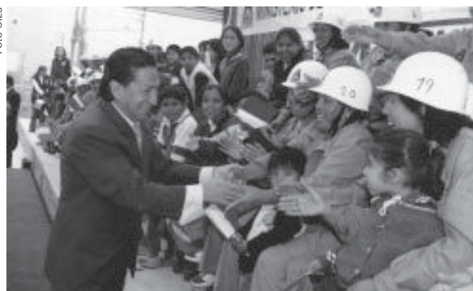
Trabajo femenino. La reforma laboral precarizó los puestos de trabajo.