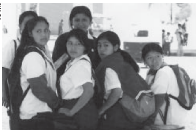
Desigualdad entre hombres y mujeres. Es estructural.