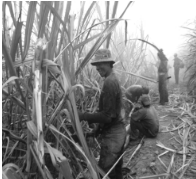
Inefectivo gasto público: el gasto público focalizado en el tema del desarrollo rural no cumple con las metas establecidas.

Las propuestas de los investigadores y de las agencias de cooperación internacional han experimentado, en este nuevo siglo, una suerte de debate y generación de consensos sobre el desarrollo rural. A continuación se discutirá sobre la vigencia del desarrollo rural en las agendas de trabajo de los actores involucrados y sobre los temas, nuevos o antiguos, que se tratan en este debate.