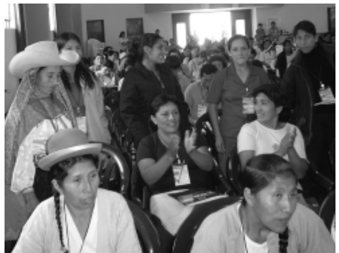
Rendición de cuentas: la ENDR podría incluir la promoción de sistemas de evaluación de las políticas.

Reducir el desencuentro entre la ENDR y lo que se hace en materia de desarrollo rural requerirá mucho poder político. El supuesto básico de esta fuerza desde la política sería el conocimiento de la existencia de un claro rédito (político, adhesión, votos, etc.) para aquellos que logren realizar este cambio. El rédito solo existirá en tanto los peruanos y peruanas reconozcamos que el desarrollo rural (en su sentido amplio, económico, inclusivo, institucional) es parte fundamental del proceso de desarrollo del país.