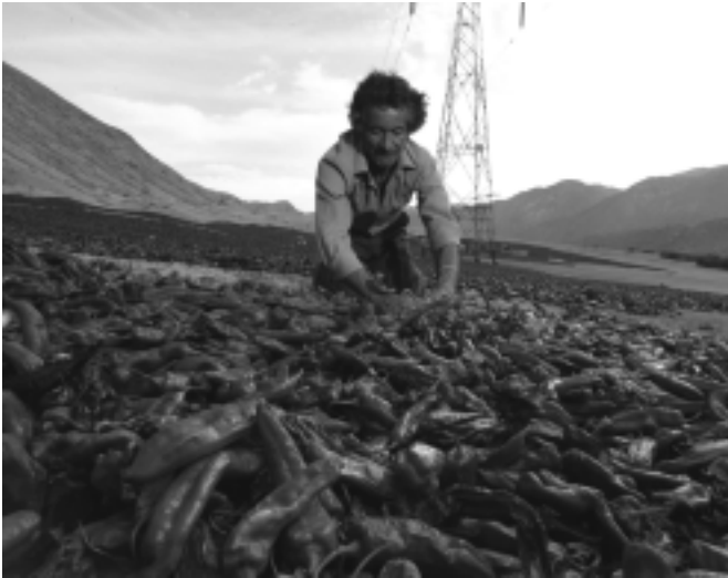
Más propuestas: tanto el sector académico como las agencias internacionales coinciden en la importancia del desarrollo rural.

de tratar lo rural sin pensar sus relaciones con el mundo urbano; que la pobreza rural es una situación que hay que enfrentar y superar, pero que el desarrollo rural es más que superar las condiciones de pobreza, entre otros.