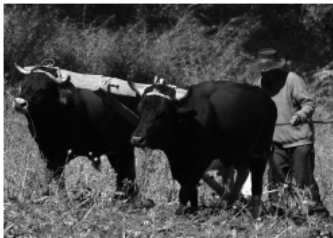
Desarticulación: es la característica de las políticas públicas sobre desarrollo rural.

La mayor visibilidad pasa por mayor análisis y debate, por mayor producción analítica, pero también por