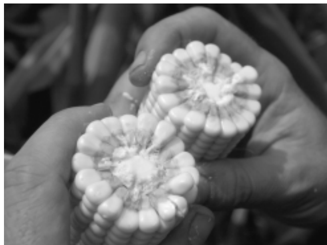
Falta claridad: los programas activos de desarrollo rural de las ONG no han logrado constituir una plataforma de acción y propuesta.

Sin embargo, se pueden encontrar algunos trabajos que dan pie a discusiones valiosas sobre temas específicos. Dos ejemplos, de muy distinta naturaleza, dan cuenta de ello. El texto producido por Eguren para el SEPIA X sobre política agraria, sugiere una mirada comprehensiva de la política relacionada con el acceso y la tenencia de tierras, y propone una hipótesis de trabajo que permite contextualizar, articular (y nutrirse de) los trabajos específicos que sobre el tema de los mercados de tierras se realizaron en los años