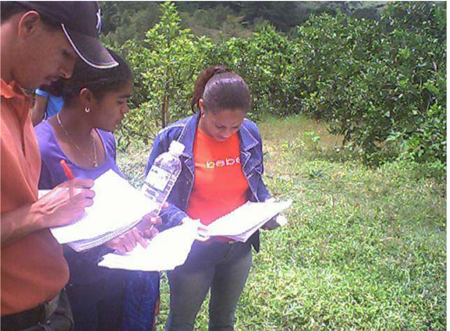
Fotografía 4: Toma de datos en boletas de campo.