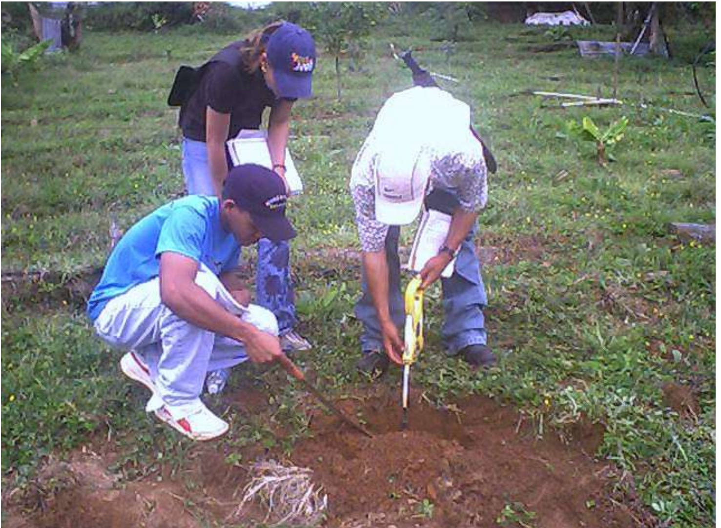
Fotografía 3: Toma de datos de profundidad efectiva del suelo.