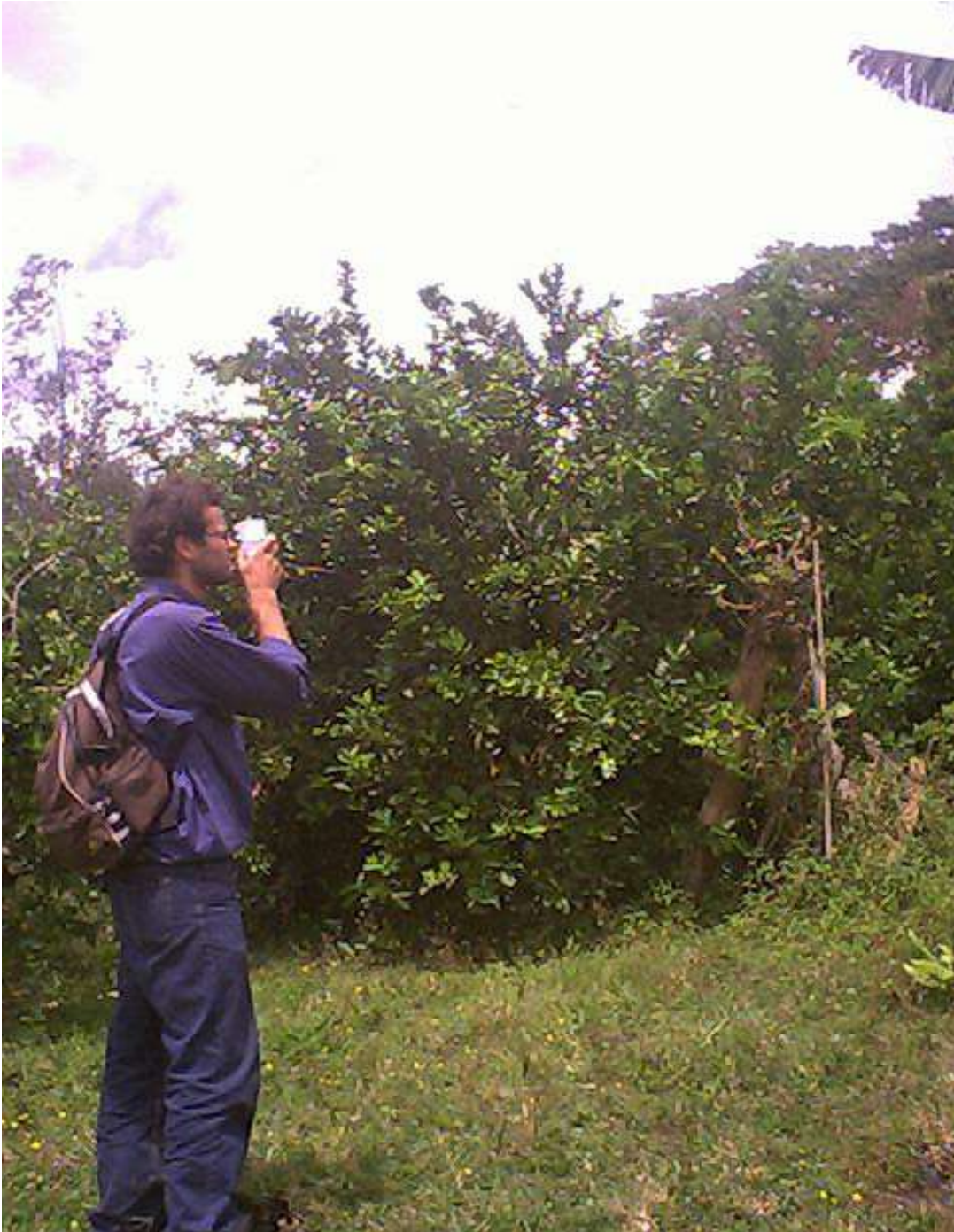
Fotografía 2: Verificación de pendiente a través de toma de datos por clinómetro.