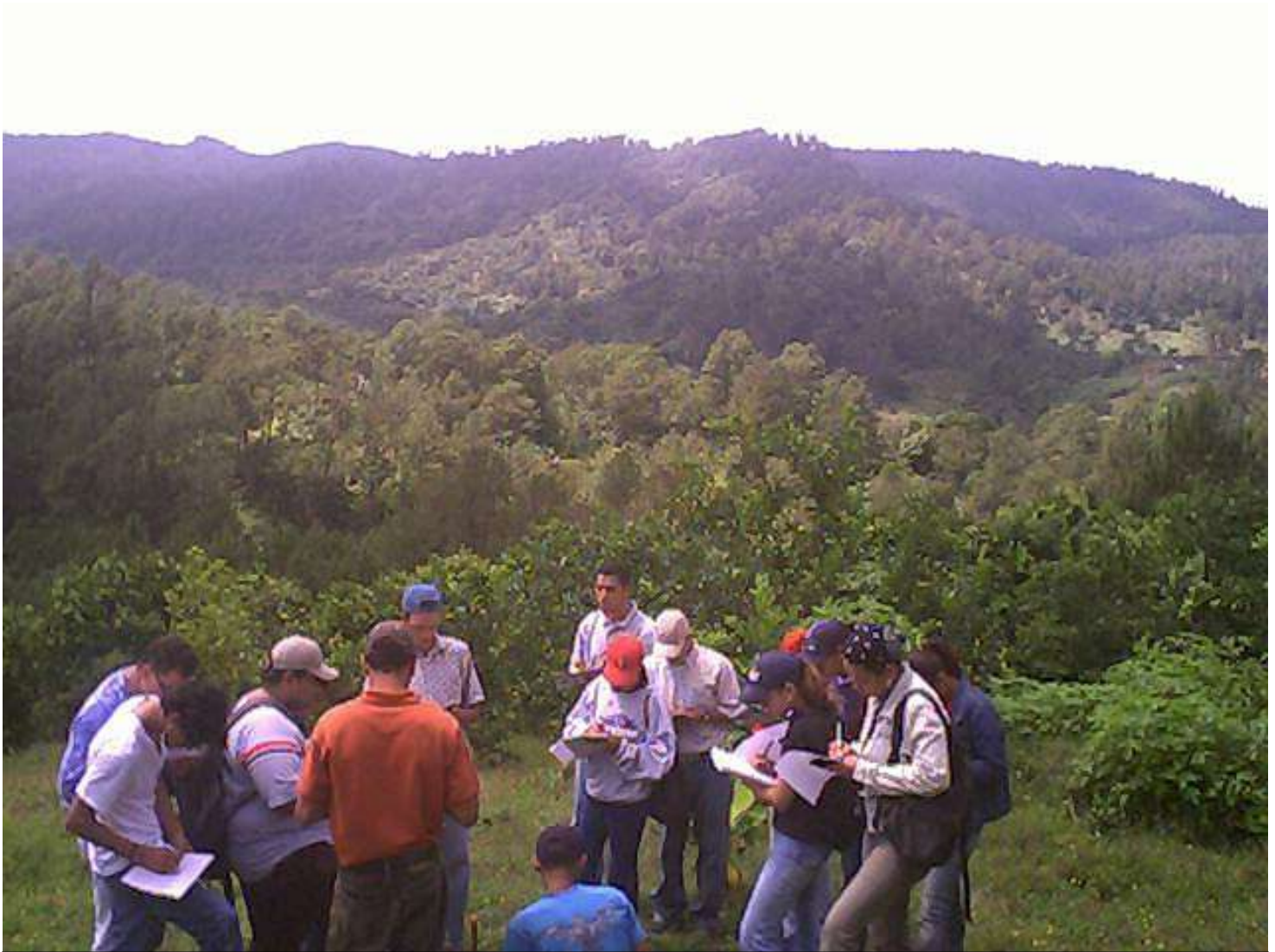
Fotografía 1: Verificación de la unidad fisiográfica a través de la visualización de entorno paisajístico (paisaje, subpaisaje y unidades de paisaje).