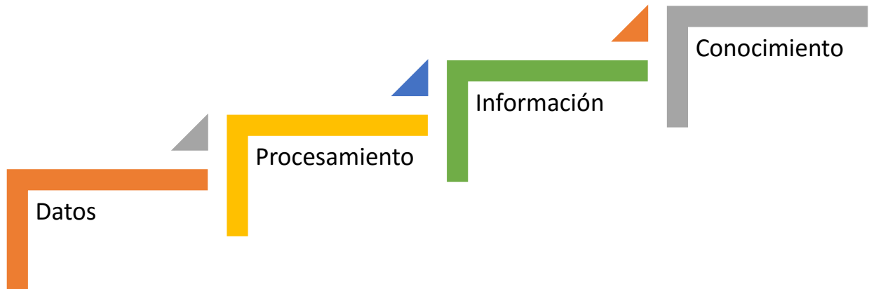
Fig. 1.1 Adquisición de conocimiento

A continuación se muestra un diagrama por el cual una persona u organización puede obtener conocimiento por medio de datos.