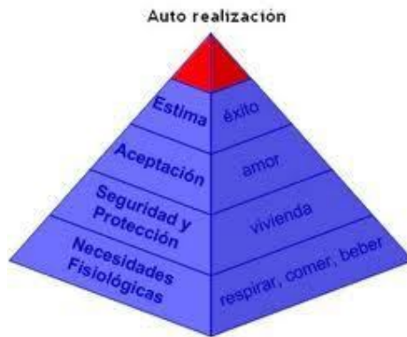
Imagen 1. Pirámide de las necesidades y motivaciones según Maslow. (Alvarado Rios, Arriola Rodriguez, Garza de la Huerta, Gonzalez Villa, Gutierrez Barajas, & Miranda Sanchez, 2012, pág. 52)