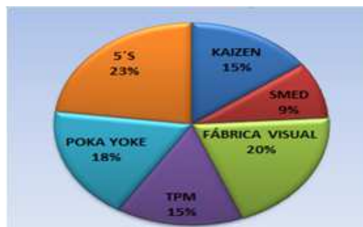
Figura 2: Implementación de las técnicas de mejora continua en Colombia

En Colombia, la metodología 5'S se ha hecho cada vez más presente en las organizaciones tales como Colcafé, Compañía Nacional de Chocolates, Noel, Zenu, Incolmos, Cervecería Unión, Grupo Corona y la empresa farmacéutica Novartis, ya que por los beneficios anteriormente mencionados, son una necesidad para alcanzar el nivel adecuado de competitividad frente a otras empresas (Arrieta, 2010). Se ha comprobado que la implementación de las técnicas japonesas es una exigencia de los clientes y/o proveedores de que las industrias asuman el mejoramiento continuo para la sostenibilidad de las mismas (Arrieta, 2003).