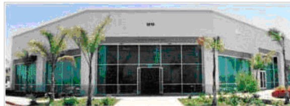
Global Domains International, Inc. Registry & Administrative HQ San Diego, CA, USA